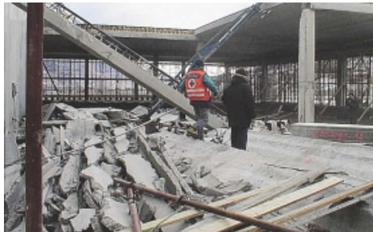
Il tetto crollato nel cantiere di Lagundo: poteva essere una tragedia

In due volano per sei metri. Salvo per miracolo il capocantiere Crolla il tetto, gravi due operai