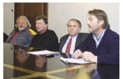
Il gruppo dell'Unione commercio in municipio